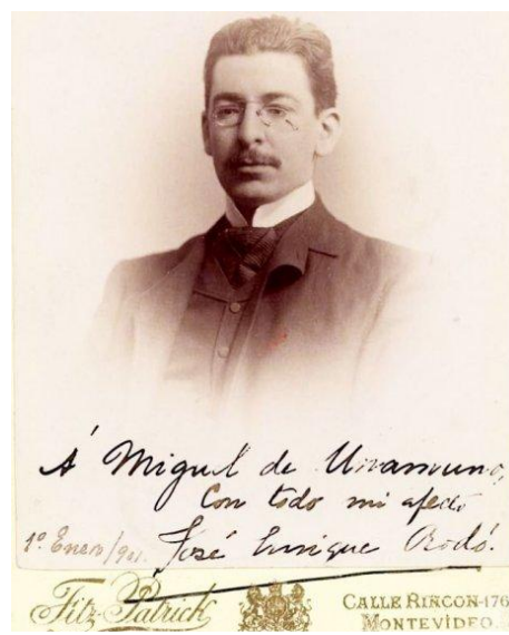
Fotografía dedicada por Rodó a Miguel de Unamuno el 1 de enero de 1901.

Rodó pareció vivir su propia muerte afrancesada en la Trinacria de 1917, como algunos en el 2017 vivimos su centenario, de manera milenarista. El fin del mundo, el milenio apocalíptico, tiene una historia, e incluso una crónica local, que en el Río de la Plata se entonó en femenino, o galicadamente, contra el fondo de un cielo estrellado en demasía: «la» fin del mundo, el paso fugaz por el feroz firmamento del Cometa Halley, el espanto seguro de estar mañana muertos que cantó Félix Rubén García Sarmiento, a.k.a Rubén Darío, muerto un año antes, en 1916, no en ninguna península sino en su ístmica, natal Nicaragua. Como los genealogistas que trabajan en la heráldica venal de los nuevos ricos, al apocalipsis cotidiano resulta fácil encontrarle linajes; finalmente, las ramas ilegítimas son las únicas que permiten llegar, a marcha forzada pero segura, hasta donde los clientes quieren, hasta la banalidad tanguera de «y en el dos mil también», banal como la de cualquier otra fecha.